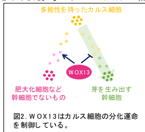
図2. WOX13はカルス細胞の分化運命を制御している。