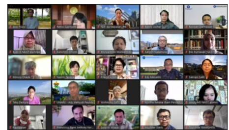
インドネシア6周年記念シンポジウムの様子